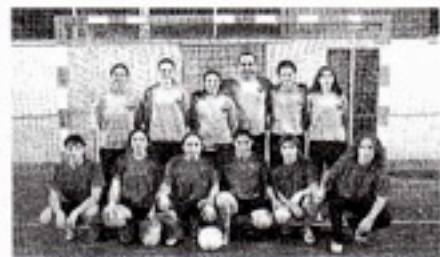
PLANTILLA. Las gaditanas hicieron un buen papel.

Tras un intenso preente en el que la plantilla ha disfrutado a la vez que ha aprendido mucho, vuelve la competición doméstica el próximo fin de semana con un choque ante el Mirandella, para acabar la primera vuelta en primer lugar.