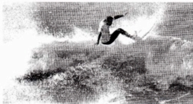
EQUILIBRIO. Los mejores 'riders' se exhibieron en la primera jornada de competición.