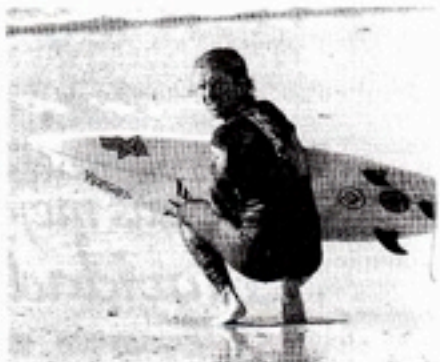
DESCANSO. Un participante se prepara para entrar en agua.