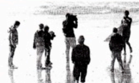
CÁMARAS. La magnitud del evento atrajo a los medios.