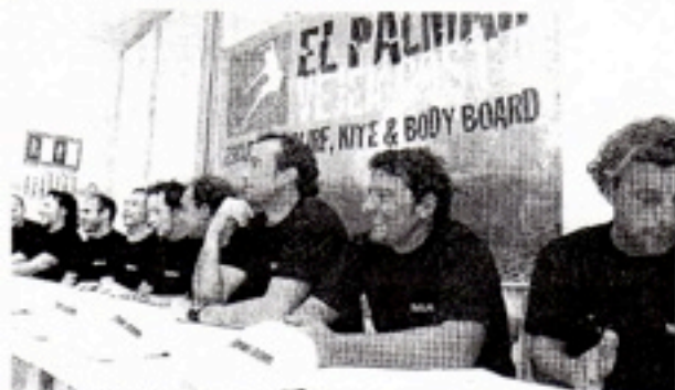
RUEDA DE PRENSA. Los organizadores presentarán el campeonato de El Palmar. J. MALO, A. GÓMEZ