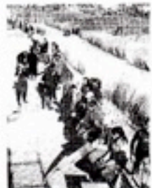
La playa, repleta.