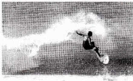
GRAN NIVEL. El mar ofreció las mejores condiciones. / G. H.