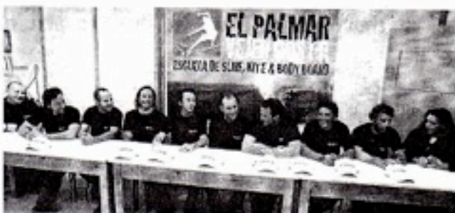
Los organizadores del evento, durante la presentación en un local de la calle Abasco en el casco antiguo de la capital.

■ Info: El miércoles se presentó en el casco antiguo gaditano el II Campeonato de Surf El Palmar, cita que ha alcanzado un prestigio entre las torneos gaditanos y que se desarrolla en la playa gaditana de El Palmar. Habrá siete modalidades para aquellos que quieran participar: Sub 14, Junior (14 a 20 años), Open (a partir de 21), Master (más de 30), Révins, Longboard y Bodyboard. Entre los surfistas que acudirán a la cita, destaca la presencia del defensor de su primera plaza en Open, Mario Aguilar, galitano y único andaluz que ha conseguido una novena posición el Campeonato del